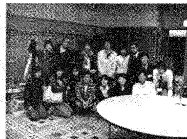
懇親会で最後まで残った若い人達